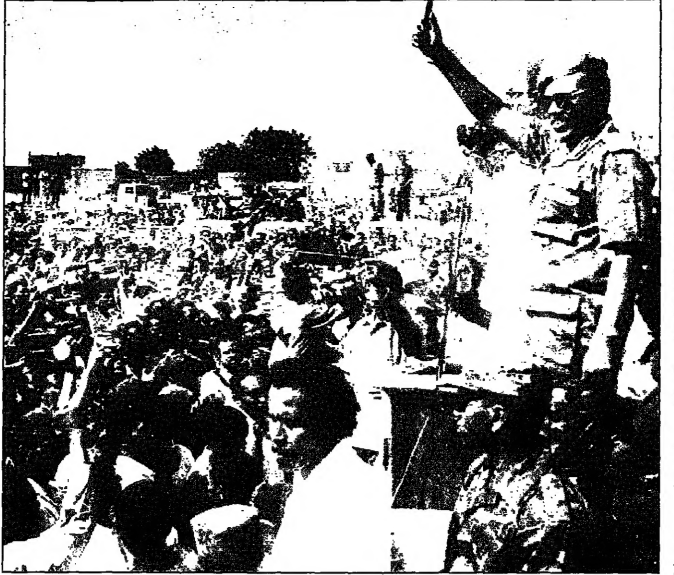
البشير يتخطب بحدث من السودانيين وسط الخرطوم